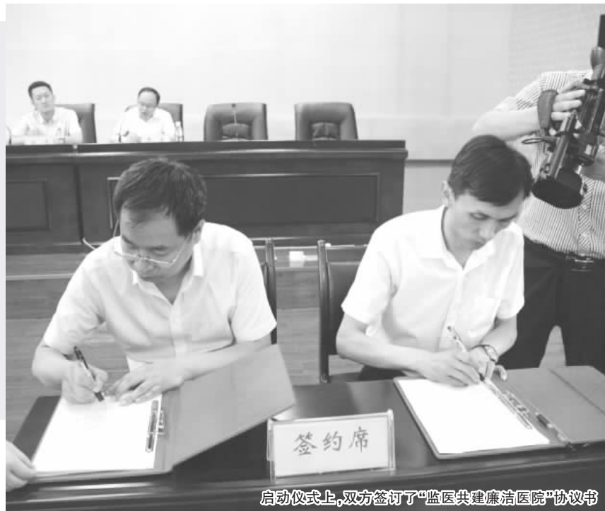
启动仪式上,双方签订了“监医共建廉洁医院”协议书

医院不定期派出纪检工作人员到区监委学习,不断提升监督执纪能力。通过集中学习、实践锻炼,不断优化